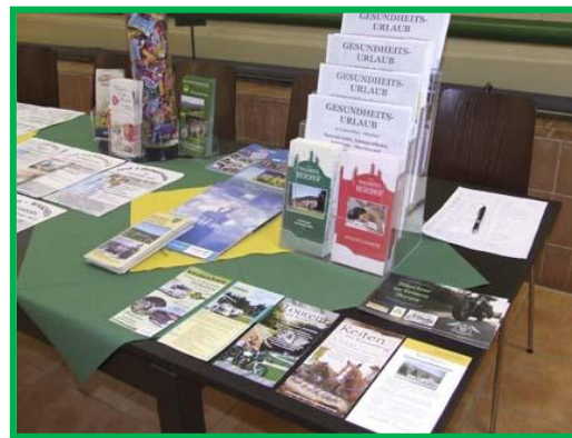
Eigenpräsentation „Thüringen Welt“